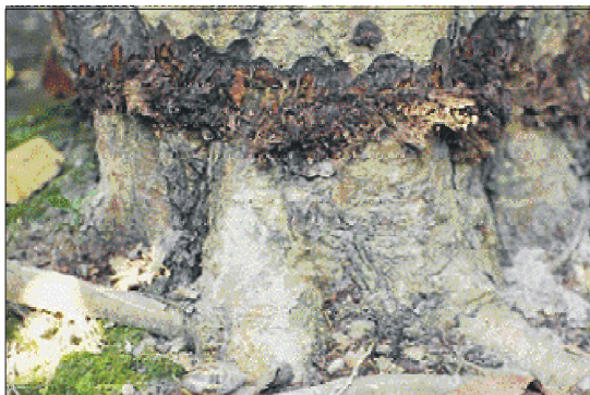
圖八. 幹基敲頭處理