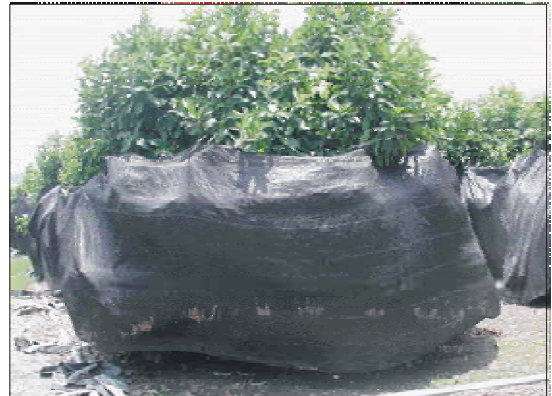
圖五. 蓋黑色遮光網(穿裙式圍四周)