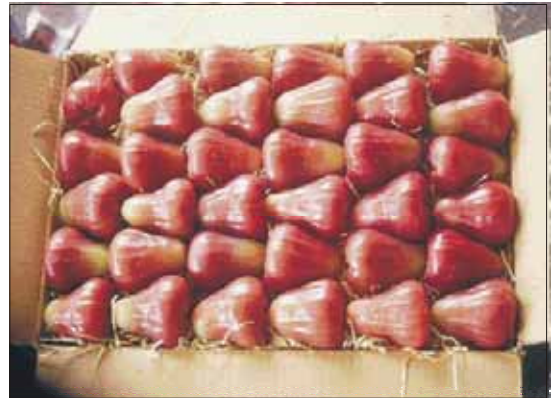
圖十五. 蓮霧紙箱裝箱