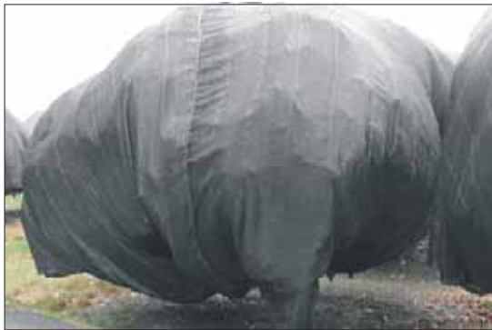
圖六. 蓋黑色遮光網(單株全面覆蓋)