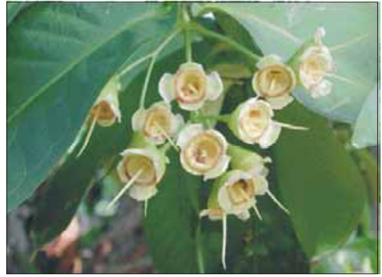
圖十一. 適合噴施生長調節劑時期之幼果