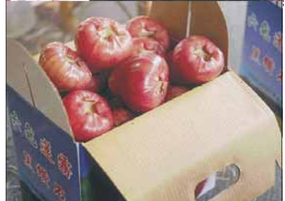
圖十四a、b. 蓮霧禮盒包裝