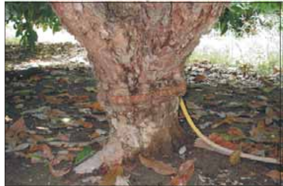
圖七. 幹基環狀剝皮處理