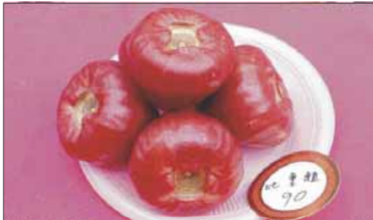
圖十二. 成熟之蓮霧果實