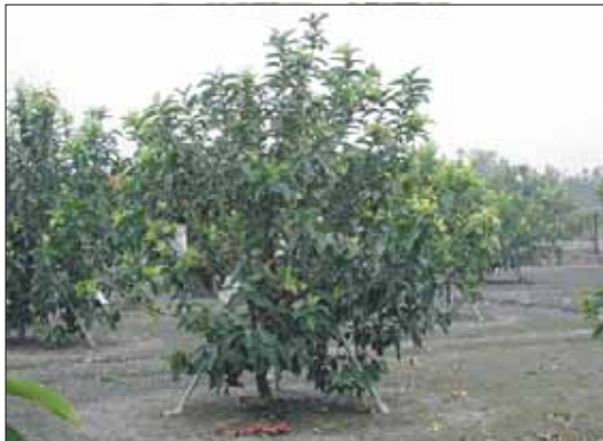
圖三. 幼齡期蓮霧樹勢