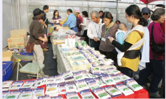
大家順便採購蔬果、種子與農業資材