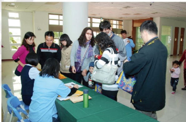
得獎者報到並領取紀念品