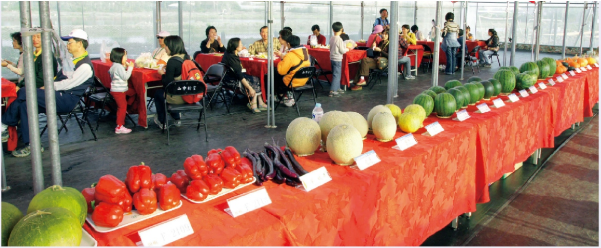
屏東場展示各種優秀的蔬果