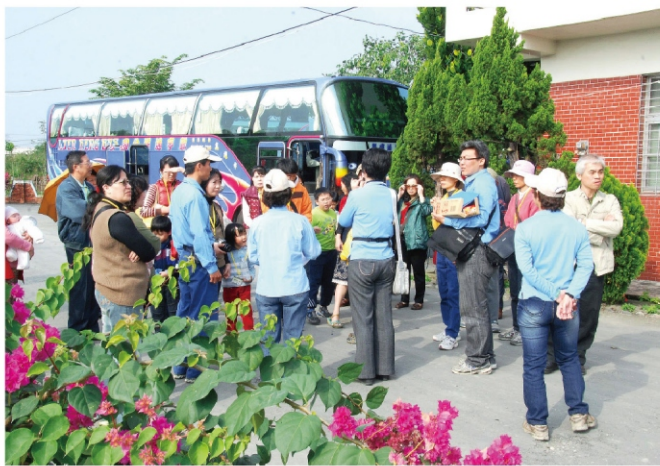
到達屏東農場後聆聽工作人員解說

幸福。早年種花都是自己留籽再種，但總是越種越糟，與農友公司往來後，才知道他們一直在研發新的品種，而且一定要用專業採收的種子才能種得好、種成功，這些專業的產品99%沒問題，我種植後果真印證農友公司的產品品質好、成功率高，因此，只要碰到想種植花草的朋友，我都向他們推薦農友公司的種子。照片中的紫藤，歐洲、中國大陸都有，日本最多，台灣的武陵農場每年3、4月盛開一大片，非常美麗；本來我們去年要到日本欣賞紫藤，但因發生大地震而沒去成；這張參賽的照片是在淡水拍的。今天是耶誕夜，祝福大家平安幸福；明天是我太太的生日，這個獎正好送她當作禮物。