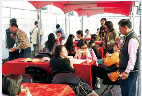
農友公司的品種真的好吃