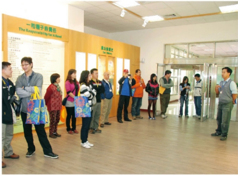
頒獎前先參觀農友陳列館