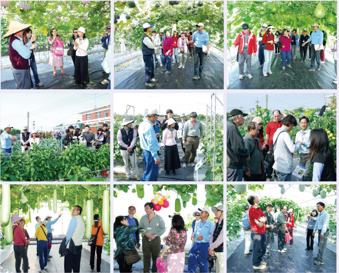
屏東研究農場中茂盛豐碩的作物，讓大家歡喜驚嘆！

得獎者將自己對園藝植物的喜好與感情敞心盡訴，也將自己的經驗與心得分享給每個人，在蔬果花卉的天地裡，大家像一家人般和諧親密地共聚一堂。頒獎致詞後，大家提出問題，無論是對植物及種苗的知識，或是對農友公司的建言與期許，甚至對基因轉殖作物的疑慮，張總經理皆清晰的說明、詳盡的解答，讓大家對農友公司更加瞭解並欽佩。