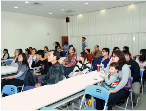
大家歡聚一堂欣賞得獎作品